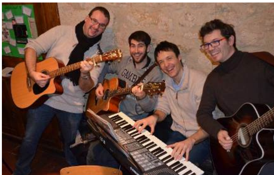
Week-end des familles