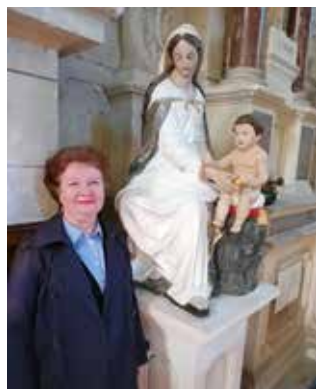
La statue rénovée de la Vierge à Saint-Jacques.