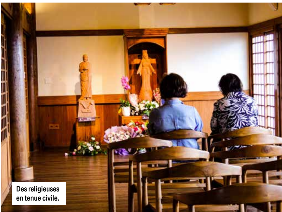
Des religieuses en tenue civile.